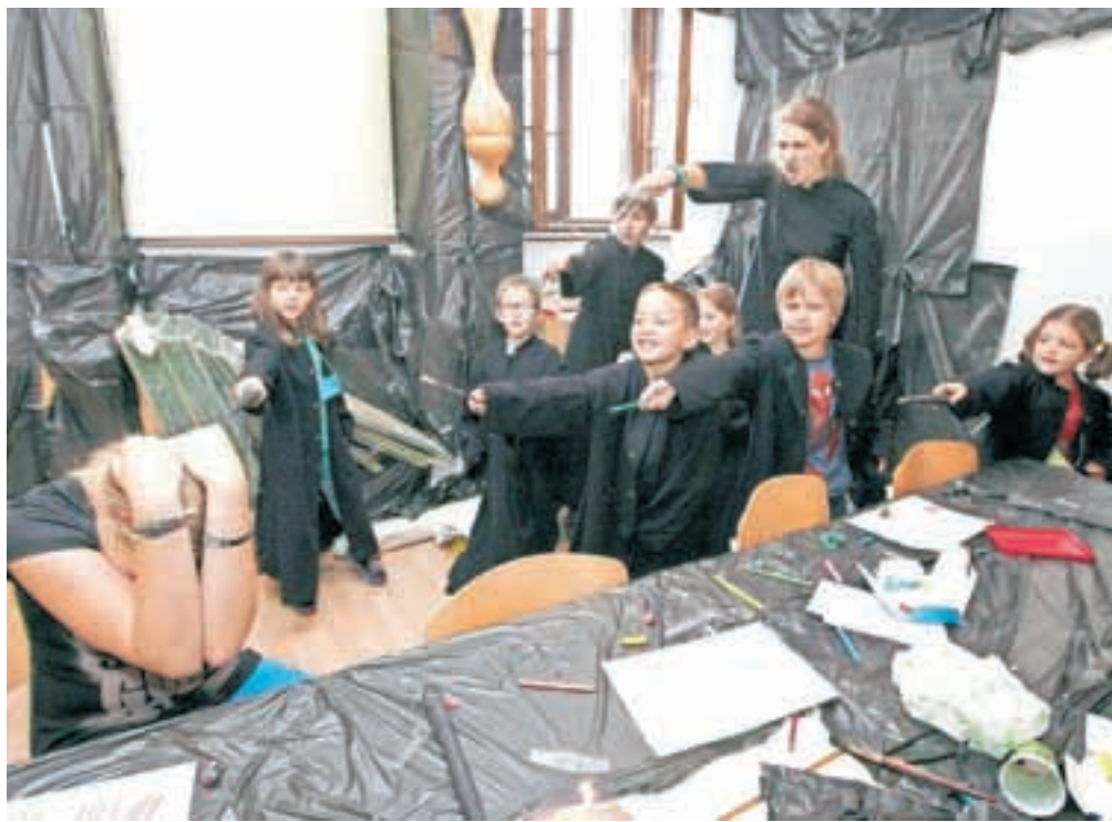
V teh počitniških dneh na oratorij v radovljiško župnišče pride več kot osemdeset otrok na dan. Med drugim so takole v slogu Harryja Potterja preganjali uroke.

Medtem ko otroci in mladostniki uživajo v brezskrbnih počitnicah, se mnogo staršev najmlajših osnovnošolcev vsako leto pred počitnicami znajde pred vprašanjem, kako poskrbeti za mladež, ki je vrtec že prerasla, za to, da bi dopoldneve preživljali sami doma, pa so vendarle še premajhni. Počitnice zanje trajajo več kot dva meseca, dopusta pa je staršem na voljo le za dobra dva tedna. In če v bližini ni babic, dedkov, starejših bratov in sester ali prijaznih sosed, družinam skorajda ne ostane drugega, kot da otroke vključijo v katero od sicer številnih, a praviloma ne prav poceni organiziranih počitniških aktivnosti. Teh je na voljo precej – od športnih do pustolovskih in takšnih, pri katerih se mladež tudi kaj nauči. Prevladujejo kombinacije športnih aktivnosti in učenja tujega jezika pa ustvarjalne delavnice, počitnice na kmetijah, v zadnjem času je priljubljeno tudi jahanje. A večina teh programov zapolni le uro ali dve počitniškega dopoldneva. Pred leti množično obiskane Sončkove počitnice, ki so